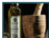
Olio e aceto